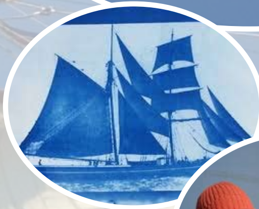
links: Fotoafdruk in cyanotype onder: Fotograaf Andris Koslovski

Het Veenkoloniaal Museum te Veendam organiseert in samenwerking met maritieme musea in Noord-Nederland een expositie aan boord van de Tromp. De oude handelsrelaties die het noorden met de landen rond de Oostzee onderhouden staan als vanzelfsprekend centraal. Daarnaast nodigen we de Letse fotograaf Andris Koslovski uit om op de Tromp mee te varen. Koslovski voer ook mee met de Volvo Ocean Race en maakte tijdens die reis prachtige foto's die hij met de oudste fototechniek rechtstreeks op papier afrukt. Zijn fotoverslag is na afloop van het project op diverse locaties te zien en kan ook in uw bedrijf worden ondergebracht.