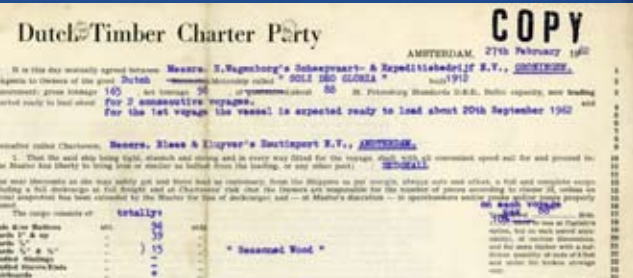
Bevrachtingscontracten uit de 20ste en de 19de eeuw