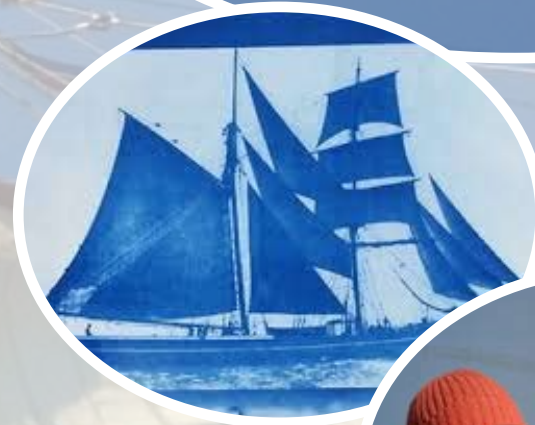
links: Fotoafdruk in cyanotype onder: Fotograaf Andris Koslovski

In samenwerking met het Noordelijk Scheepvaartmuseum te Groningen en het Fries Scheepvaartmuseum te Sneek organiseert het Veenkoloniaal Museum te Veendam een expositie aan boord van de Tromp en reizende exposities in de genoemde havensteden. De oude handelsrelaties die het noorden van Nederland met de landen rond de Oostzee onderhield staan als vanzelfsprekend centraal. Daarnaast nodigen we de Letse fotograaf Andris Koslovski uit om op de Tromp mee te varen. Koslovski voer ook mee met de Volvo Ocean Race en maakte tijdens die reis prachtige foto's die hij met de oudste fototechniek rechtstreeks op papier afrukt. Zijn fotoverslag is na afloop van het project op diverse locaties te zien en kan ook in uw bedrijf worden ondergebracht.